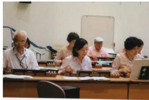
訪問も好評ですの声が飛び交いました。