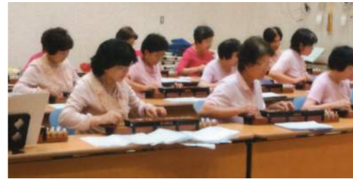
「お久しぶりです」「お変わりありませんか」と語り合うひととき。演奏も心一つに。