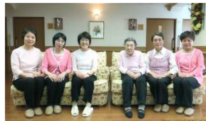
演奏も無事終わり 素敵なソファで一休み

新緑かがやく4月27日、ニチイホーム大和に伺いました。こちらは毎回お誕生日会です。